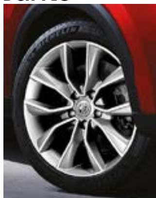
Jante aliaj 17"