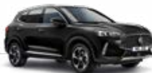
Pebble Black (metallic)