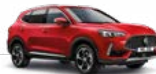
Diamond Red (metallic)