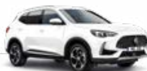
Dover White (non-metallic)