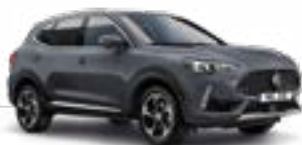
Magic Grey (metallic)