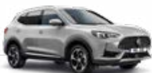
Medal Silver (metallic)