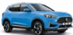
Brighton Blue (metallic)