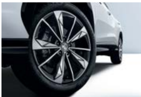
Jante aliaj 19"