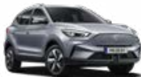
Monument Silver (metallic)