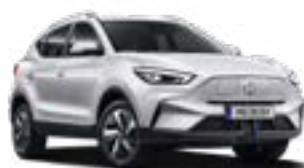
Dover White (non-metallic)

*Plata se va face în Lei la cursul de vânzare CEC BANK din ziua efectuării plății (cursul SPOT de vânzare pentru tranzacții interbancare și cursul de vânzare la casierie pentru plățile în numerar la casieria Vânzătorului).