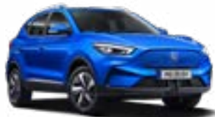
Cosmo Blue (metallic)