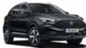
Pebble Black (metallic)