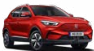
Diamond Red (metallic)